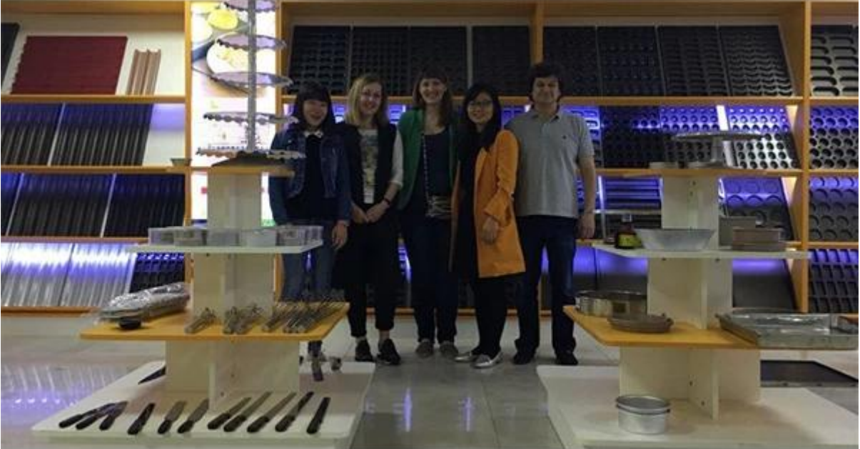
... Tsingbuy ... Pullman ... Starp ...