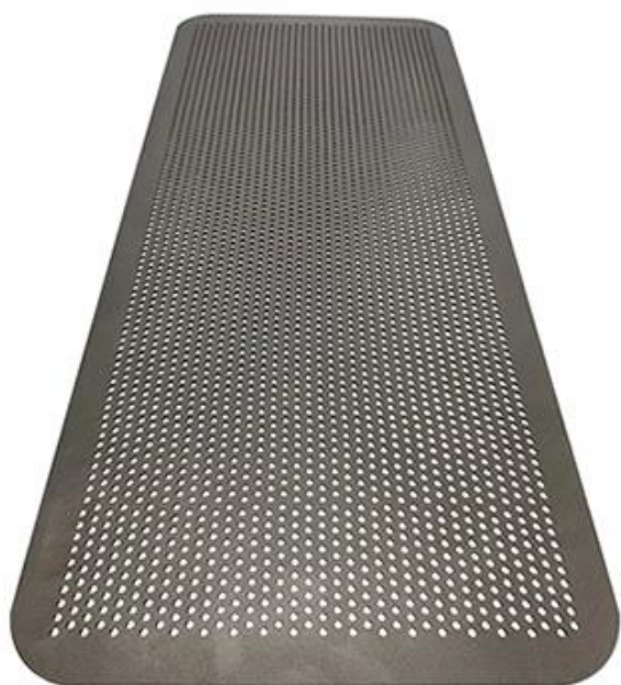
Front side non-stick surface