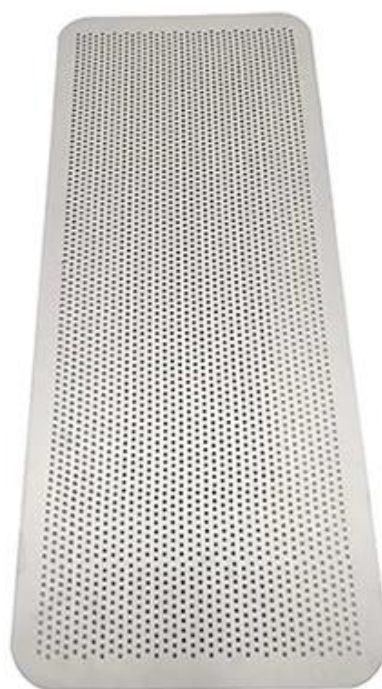
Back side natural surface