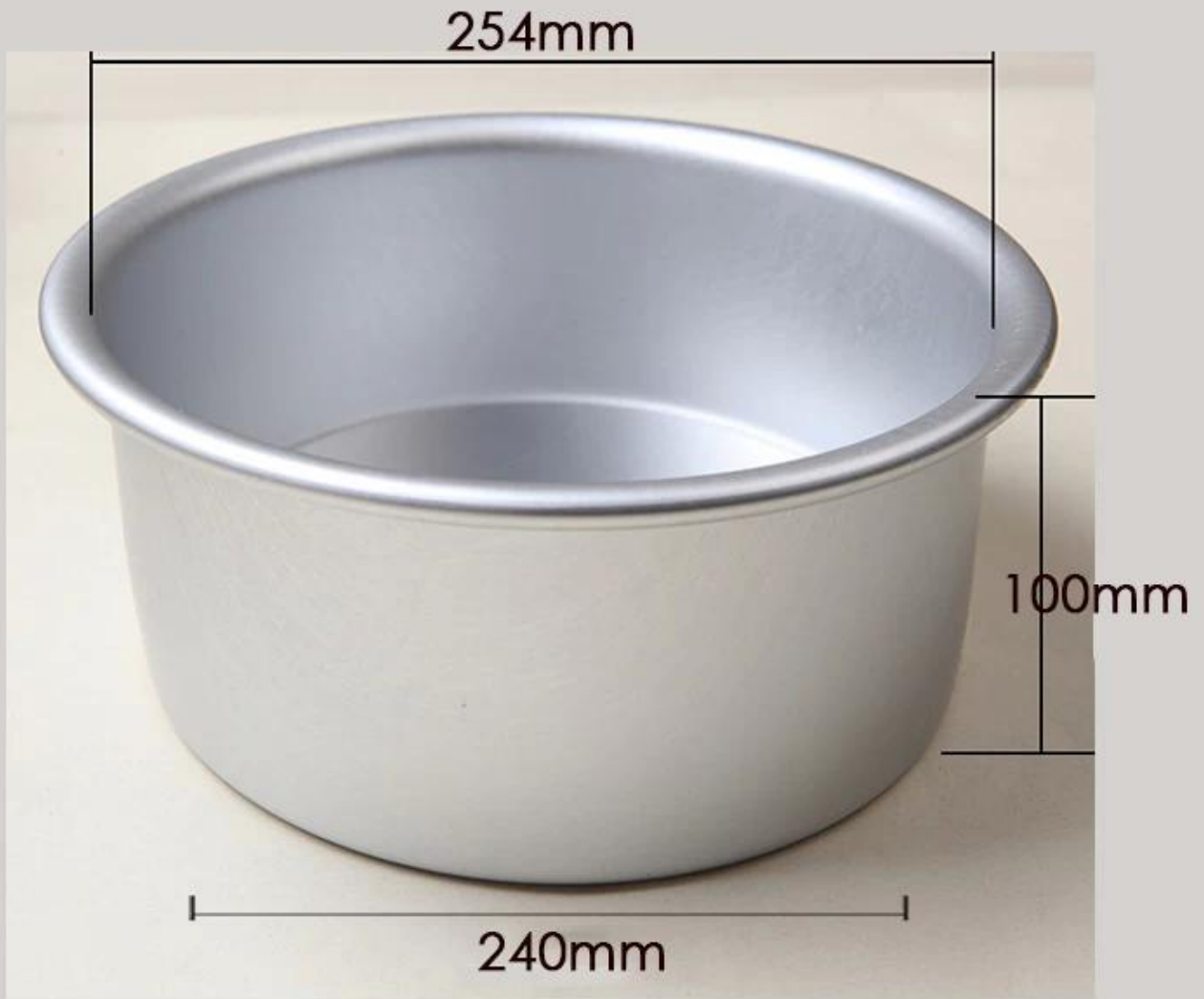
10" Deep Cake Pan weight: 370g