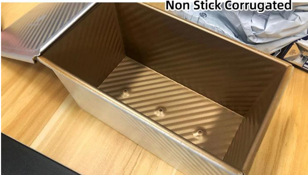
Non Stick Corrugated