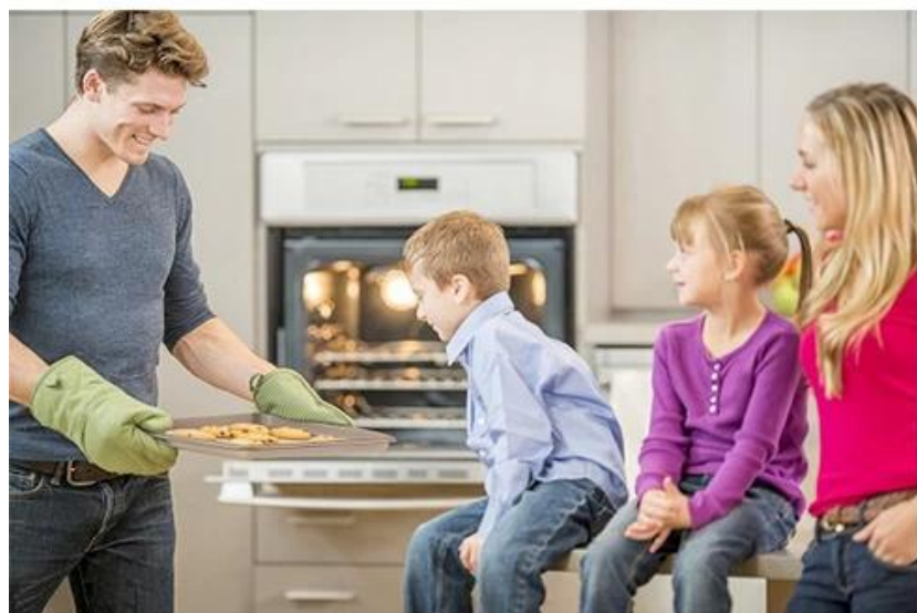
Enjoy family baking time