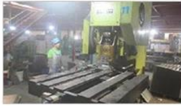
Automatic punching machine