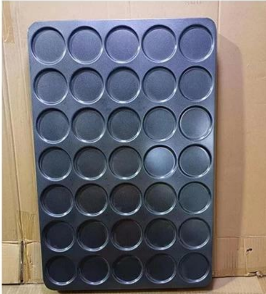
Large size for industrial use