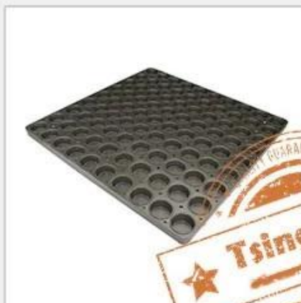
holes for air flow