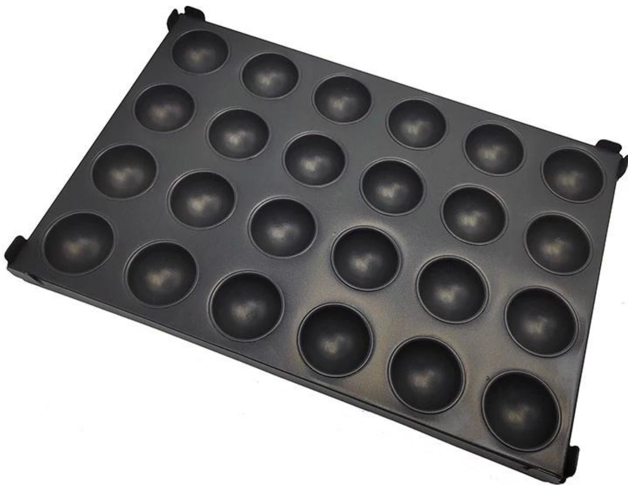
Форма для выпечки торта в форме полусферы, форма для выпечки хлебобулочных изделий, поднос для духовки