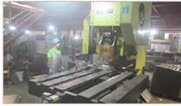
Automatic punching machine