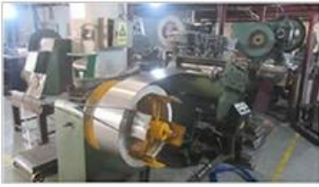
Automatic cutting machine