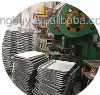
Standard production flow