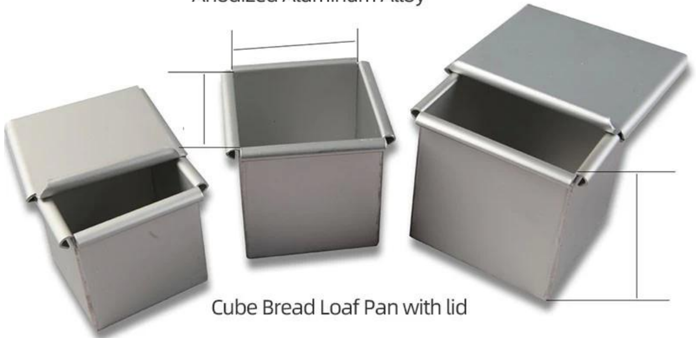
Cube Bread Loaf Pan with lid