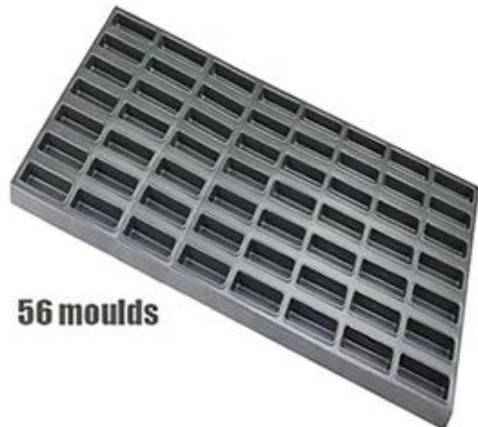
Антипригарный лоток для кексов с картинками и демонстрационным залом