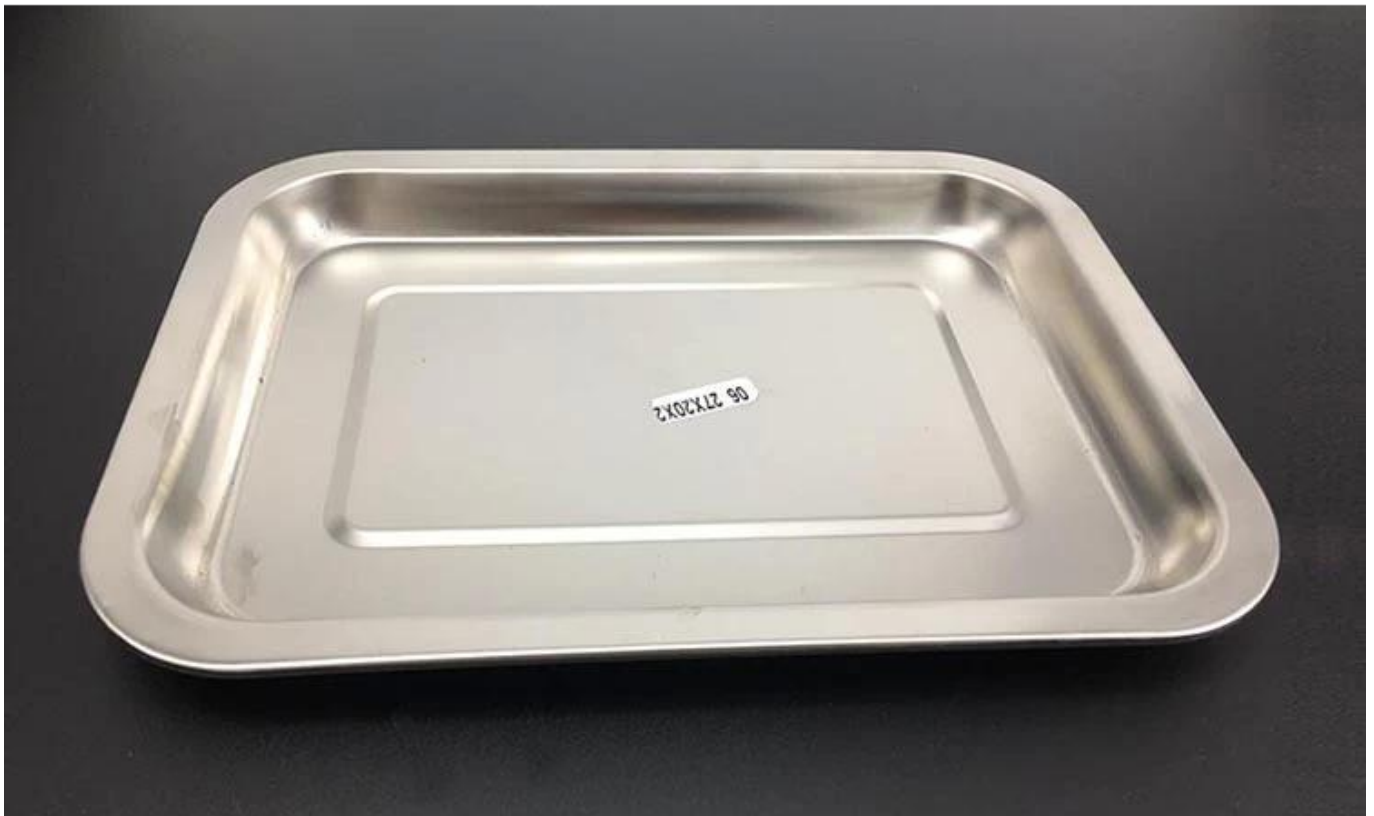
Рисунок S из нержавеющей стали 304 плоский лоток

Лотки одинакового размера можно штабелировать, экономя место