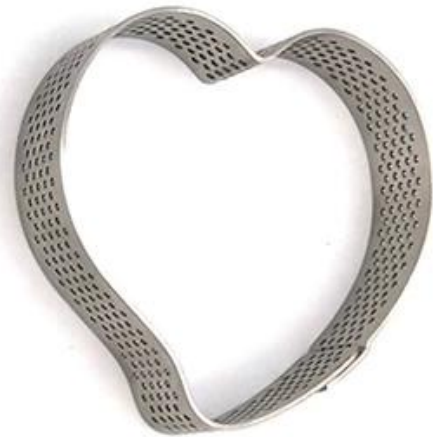
Heart shaped 76*71*20mm