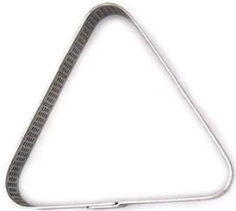
Triangle shape 83*75*20mm