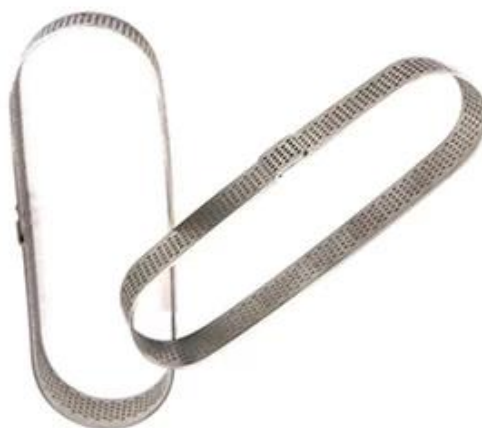
Oval shape 85*35*20mm