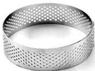
Round shape 70*70*20mm