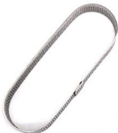
Oval shape 93*58*20mm