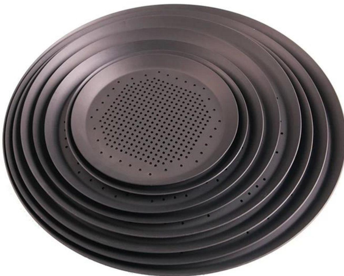
Imagem do Produtos de pizza de antiaderente alumínio assadeira com orifícios