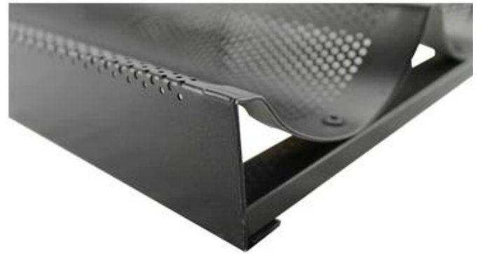
Aluminum alloy simple frame