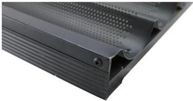
Aluminum alloy strengthening frame