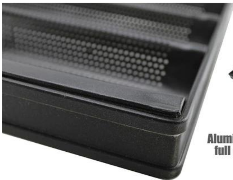
Aluminum alloy full envelope