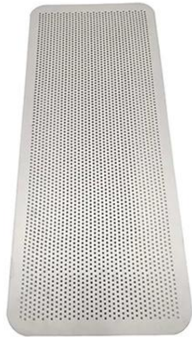
Back side natural surface