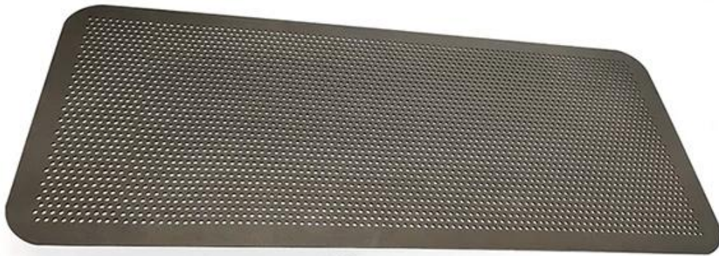
Imagem do Produtos de antiaderente em alumínio assadeira plana perfurada

Ele foi projetado especialmente para biscoitos / biscoitos finos da Tsingbuy, que é um experiente fabricante de assadeira plana com equipe profissional, excelente serviço, produção de fábrica altamente qualificada e envio a tempo.