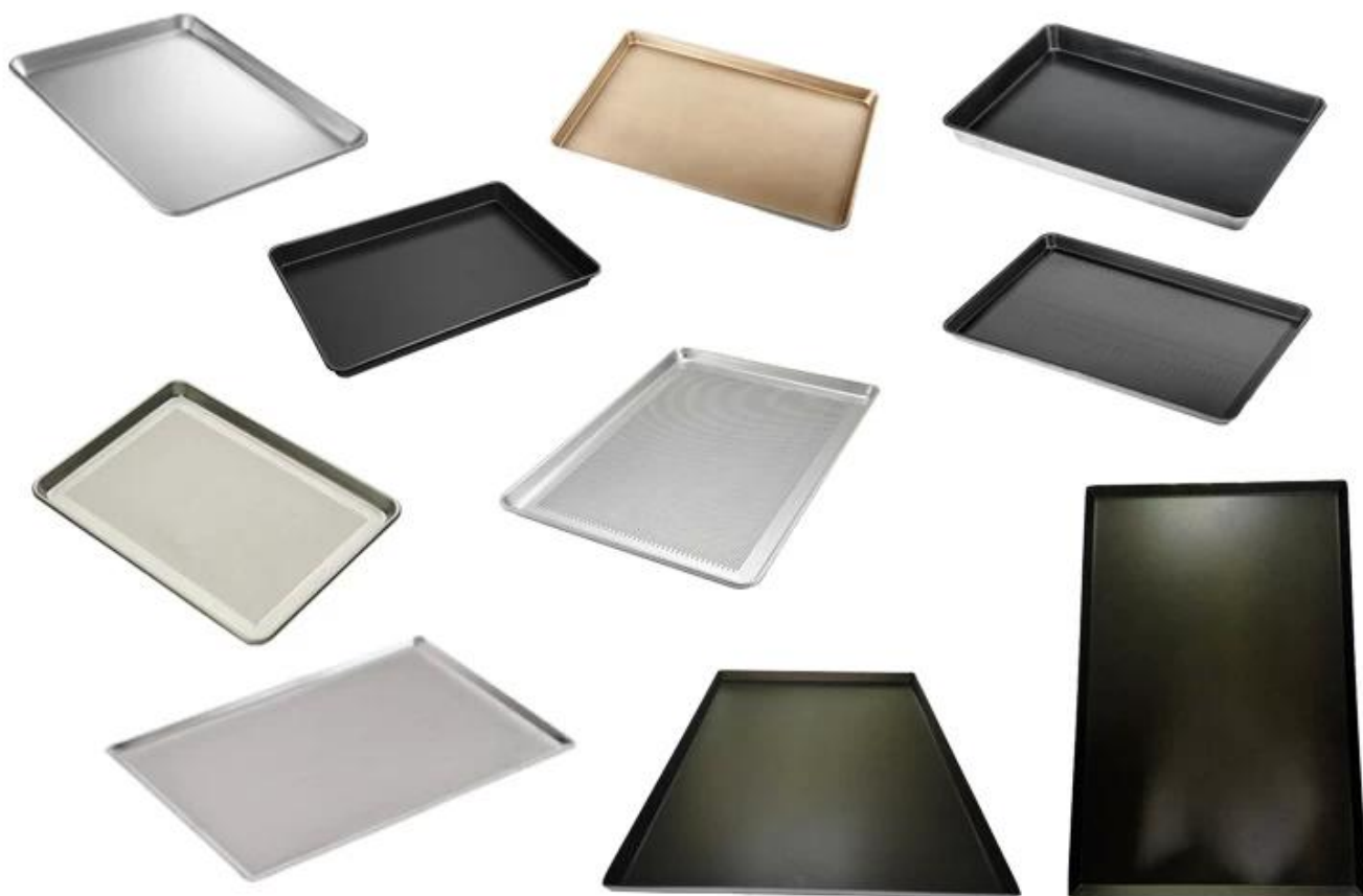
Fábrica de assadeiras As fotos