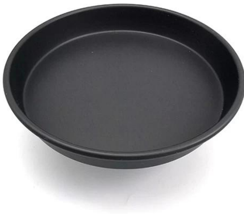
Imagem do Produtos de alumínio pizza profunda antiaderente redonda panela