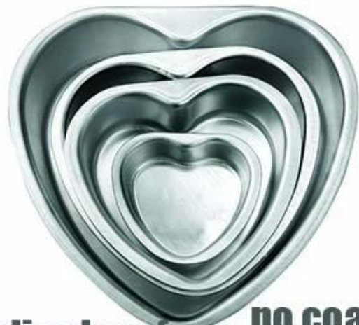
anodized surface no coating