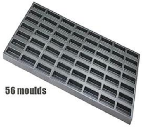
Fotos de fábrica