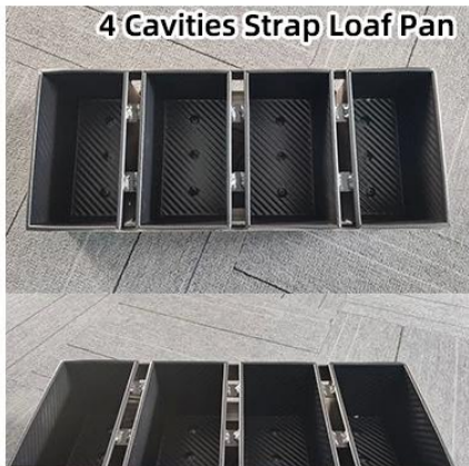
4 Cavities Strap Loaf Pan