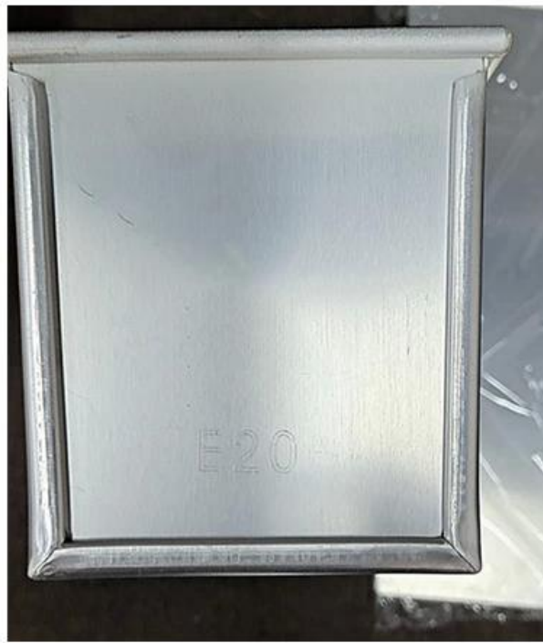
Holes at bottom