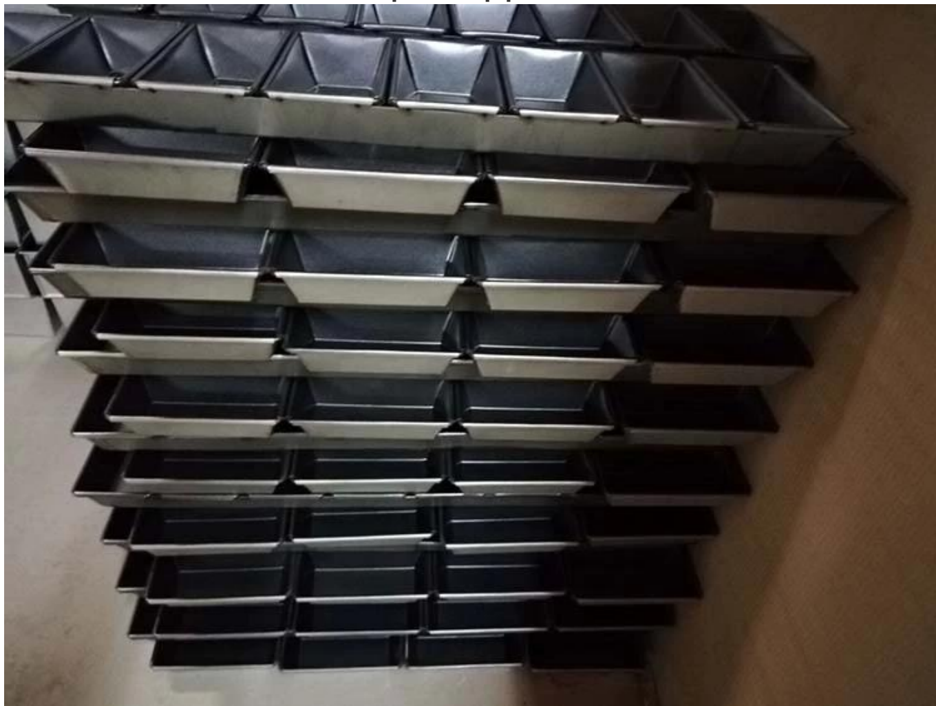
Fotos de fábrica do fornecedor de pan strap pan