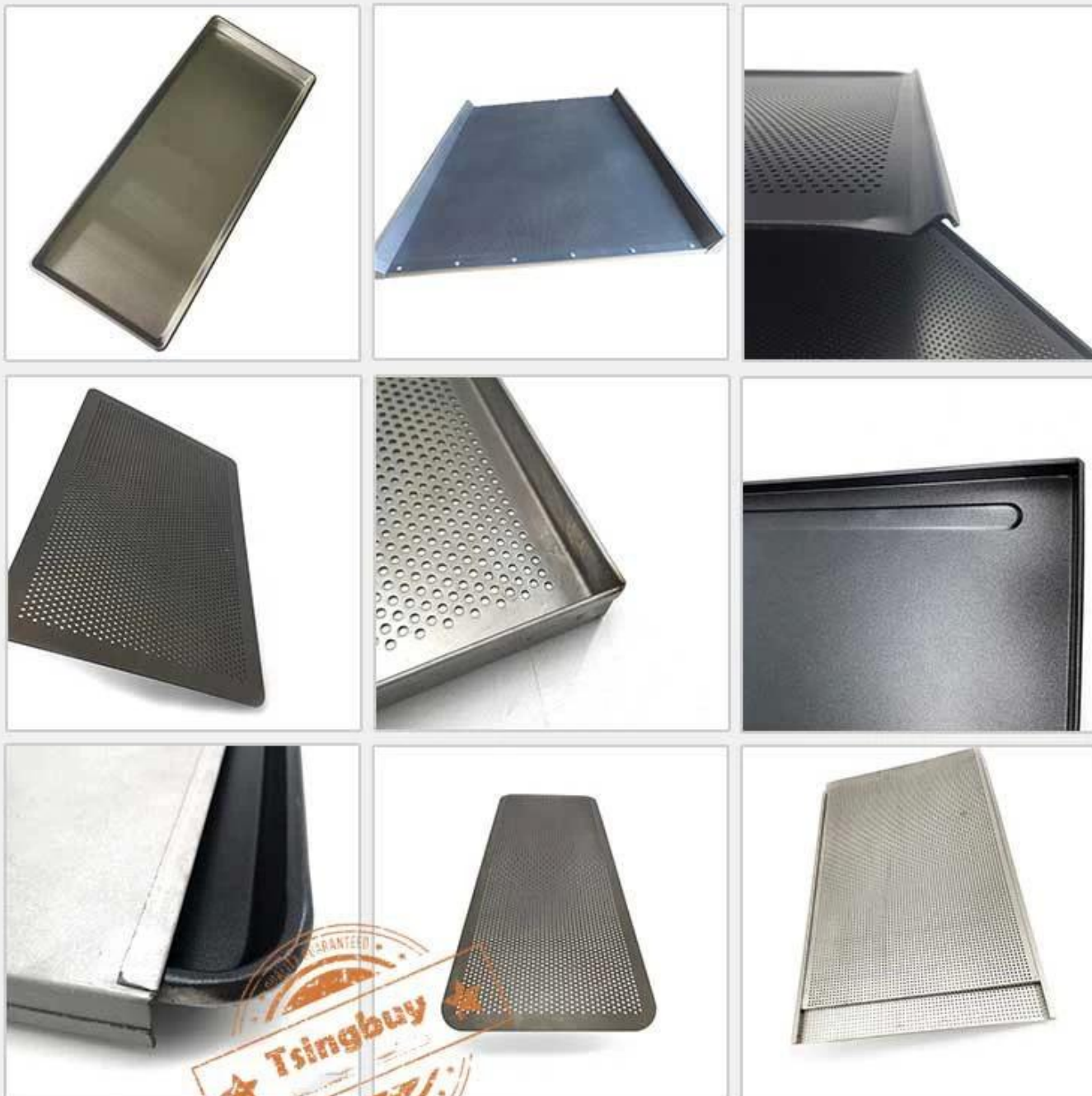
sheet pan with lid