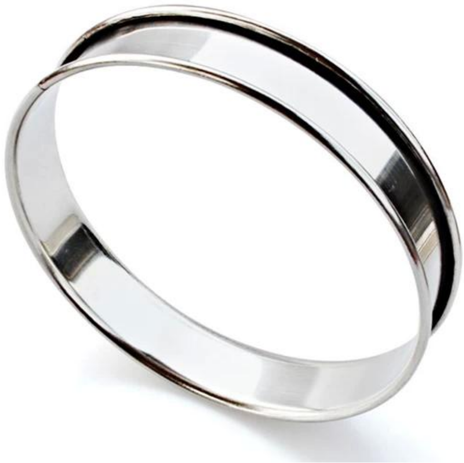
Fotos de anel de torta perfurada