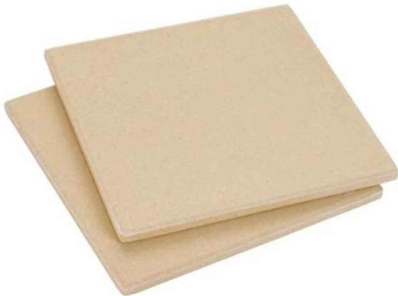
Personalizado cozimento pizza pedra