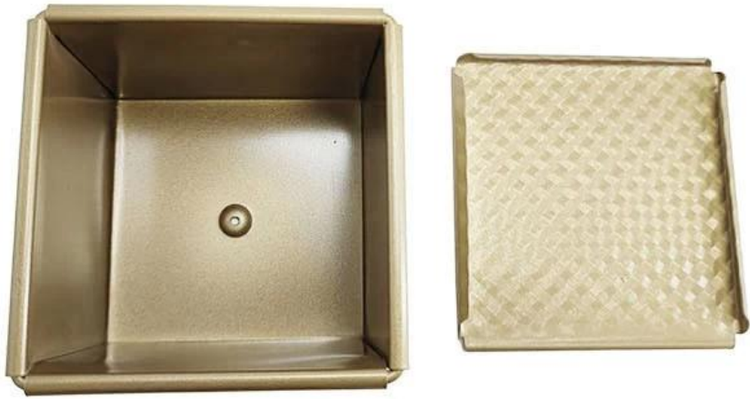
Square Cube Shaped Bread Loaf Pan