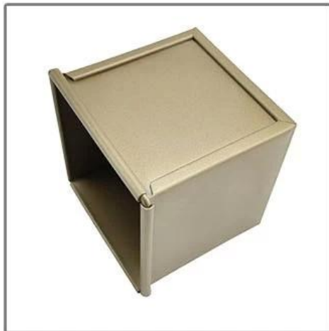
Custom Manufacturing Available