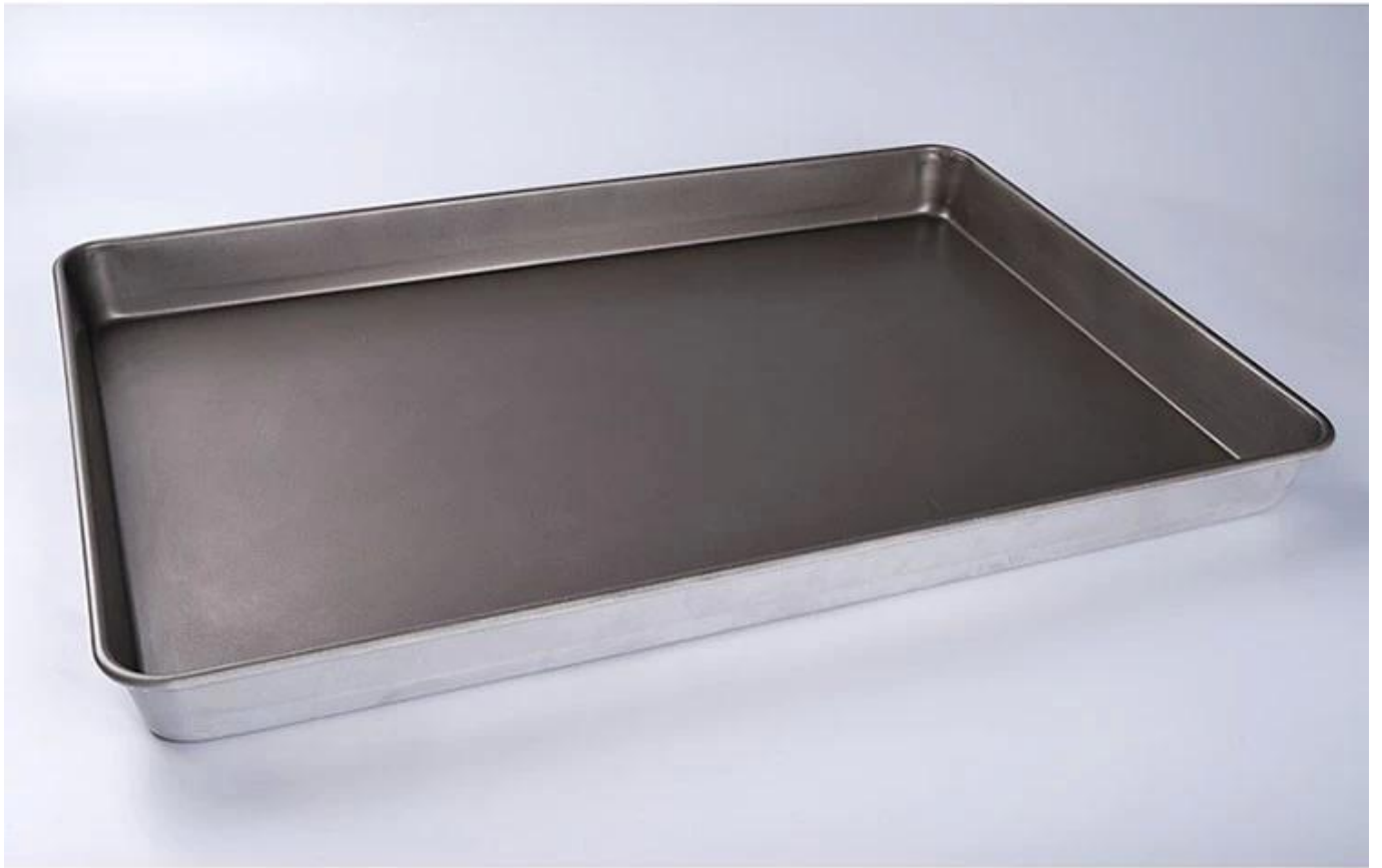
Aluminized Steel Material Light in weight, Good Heat Conductivity