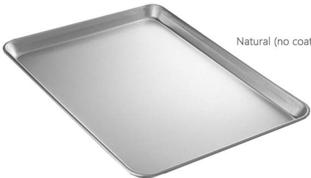
Natural (no coating)