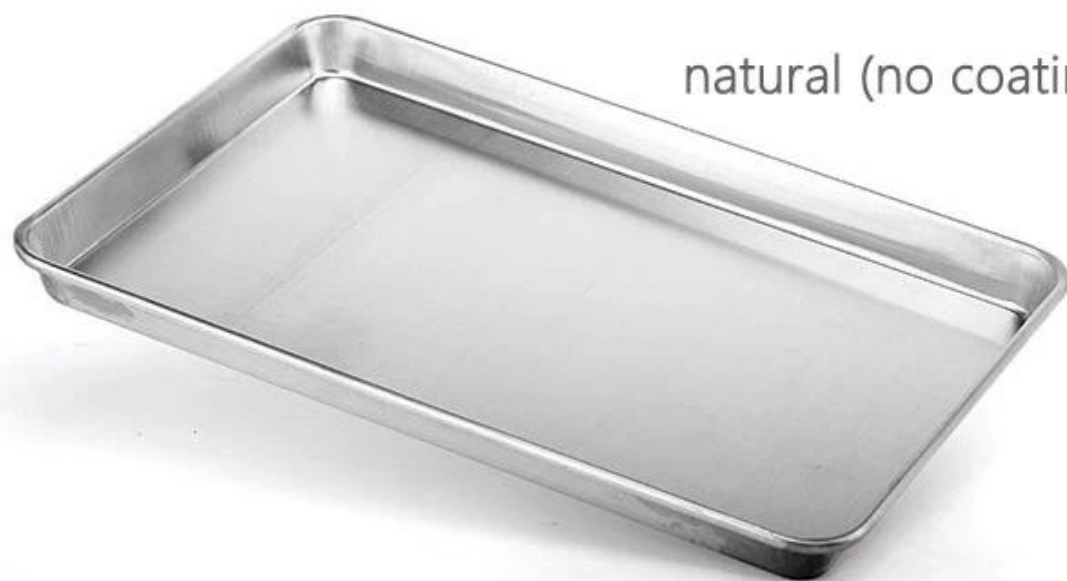
natural (no coating)

Detalhes de antiaderente corrugado alusteel assadeira pan