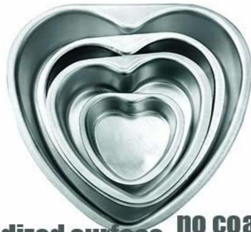
anodized surface no coating