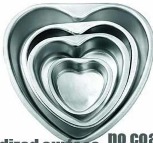
anodized surface no coating