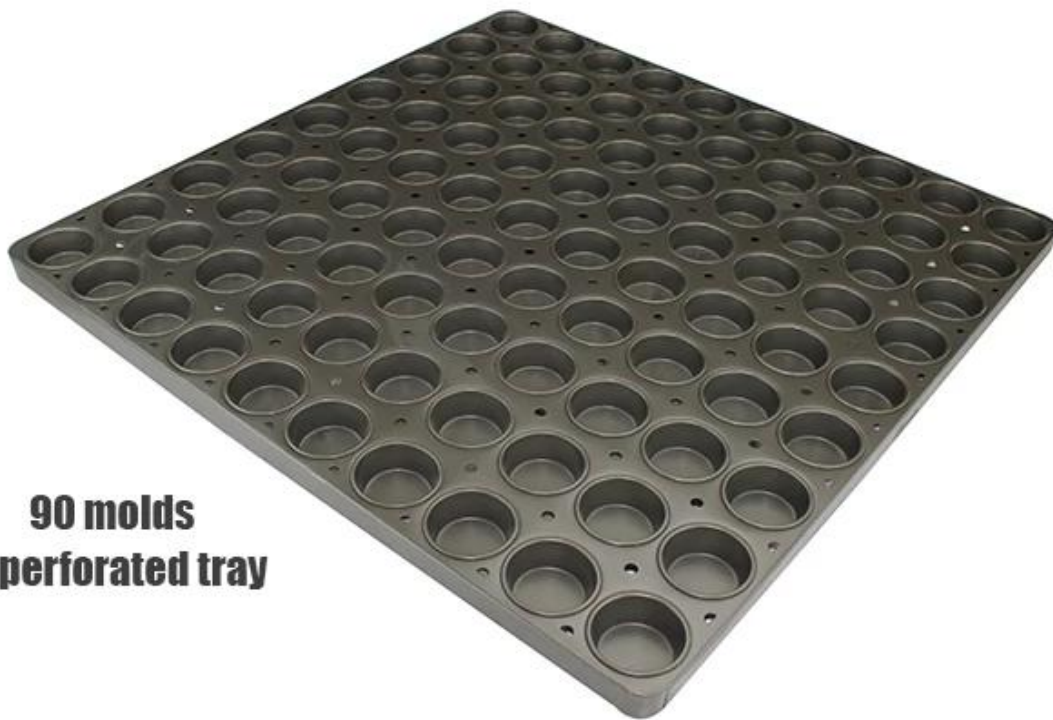
90 molds perforated tray