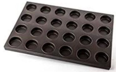
mold bottom with hole