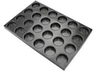
round tray corner