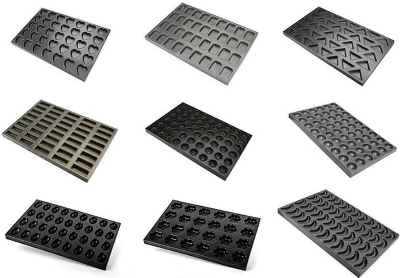
Bandeja do copo da indústria, panelas que mostra a sala