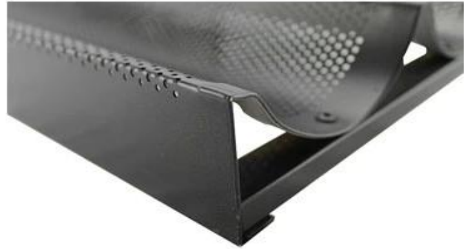
Aluminum alloy simple frame