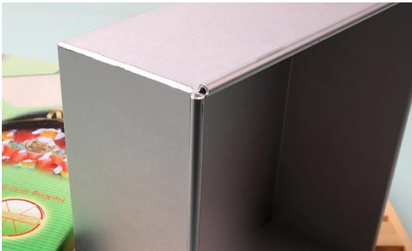
custom color box packing