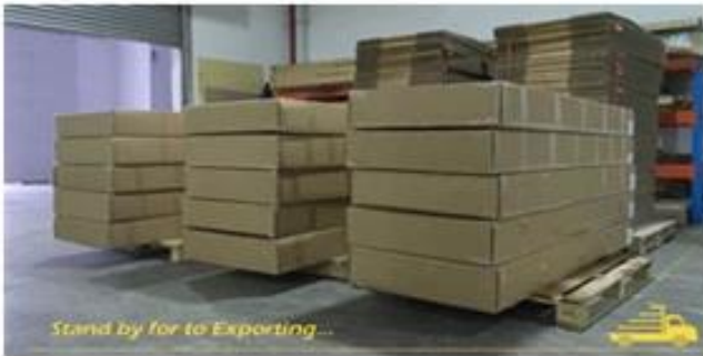
Stand by for to Exporting...