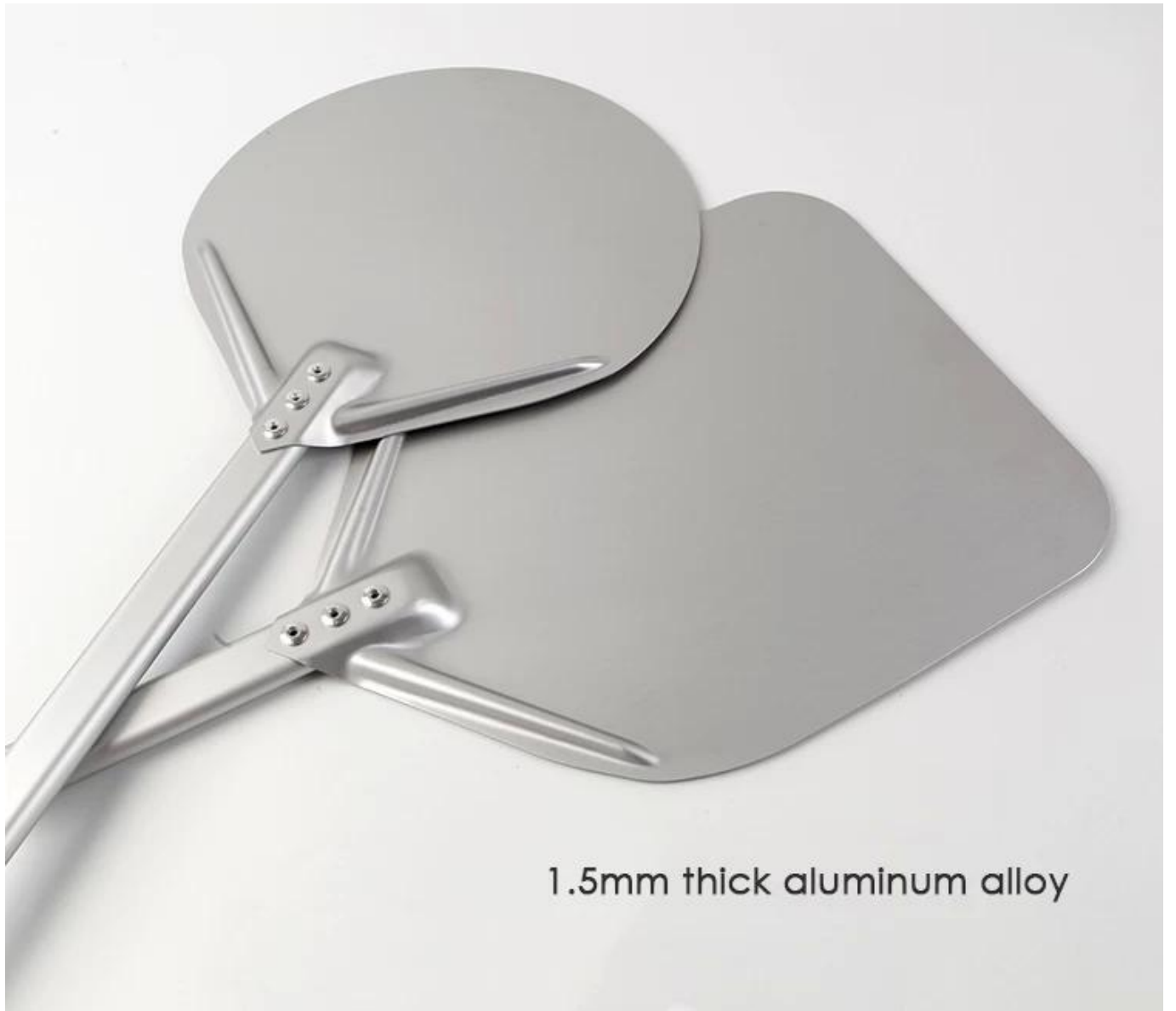
1.5mm thick aluminum alloy