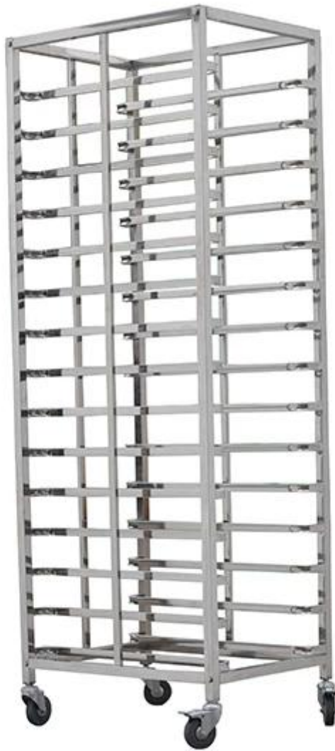
Zdjęcia producenta wózka ze stali nierdzewnej