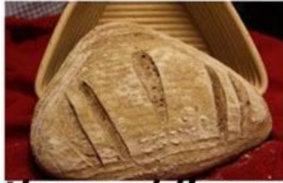
Formentation molding perfect banneton