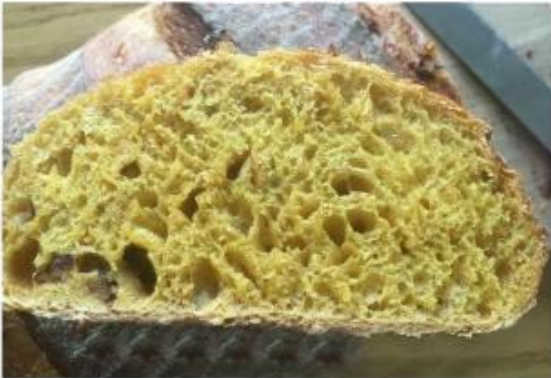
using baking pizza stone