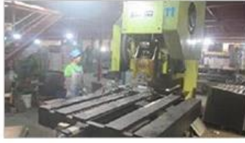
Automatic punching machine