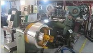
Automatic cutting machine