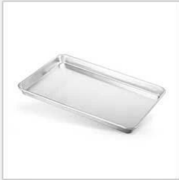
wire in rim