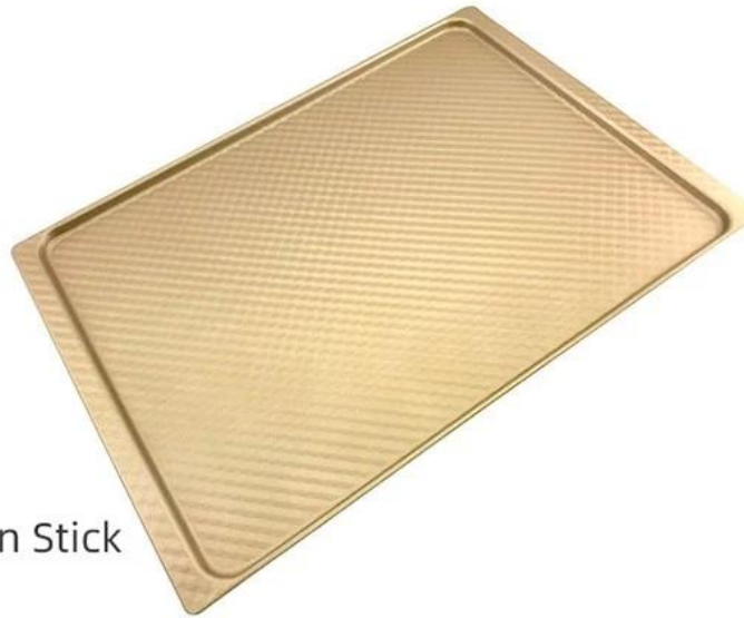
Corrugated Non Stick Oven Tray