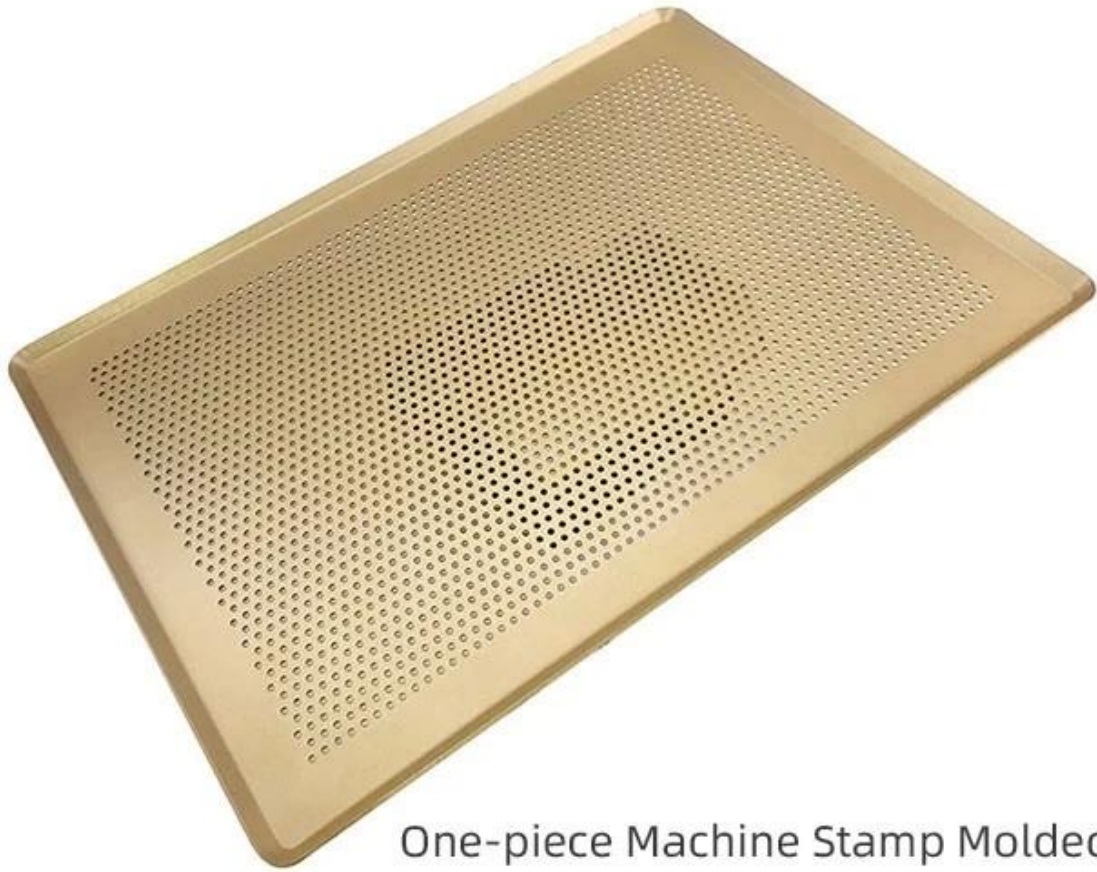
One-piece Machine Stamp Molded Baking Tray with Perforation