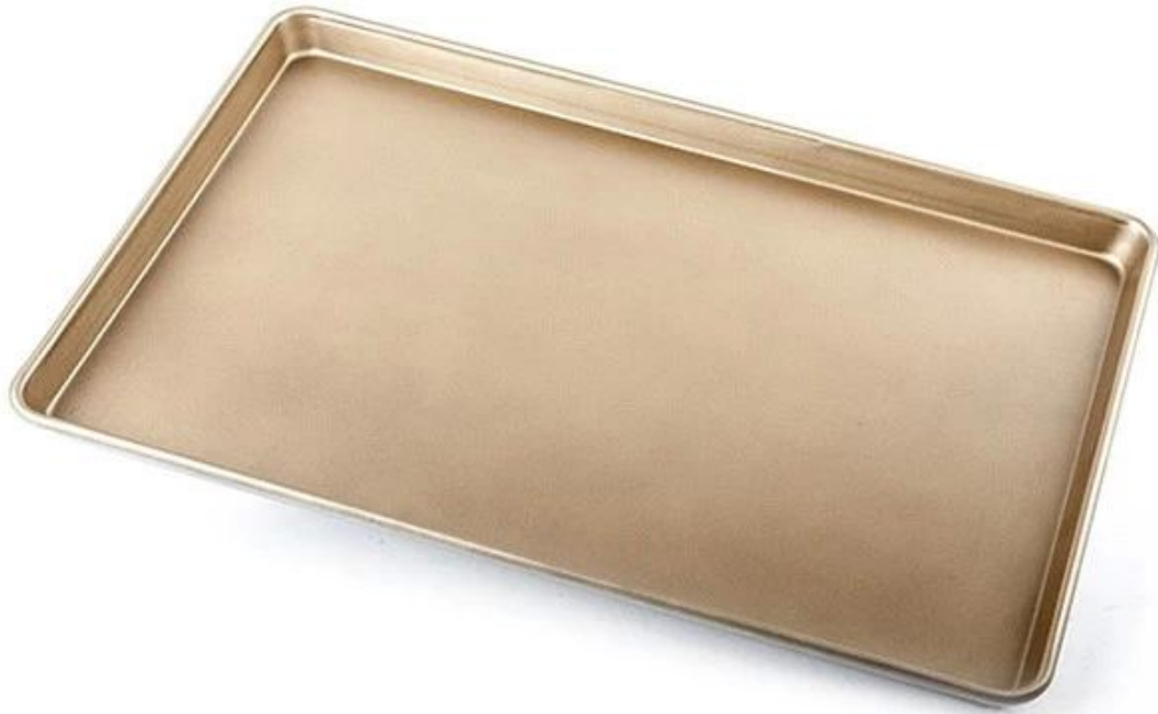
Machine stamp with metal wire curling rim