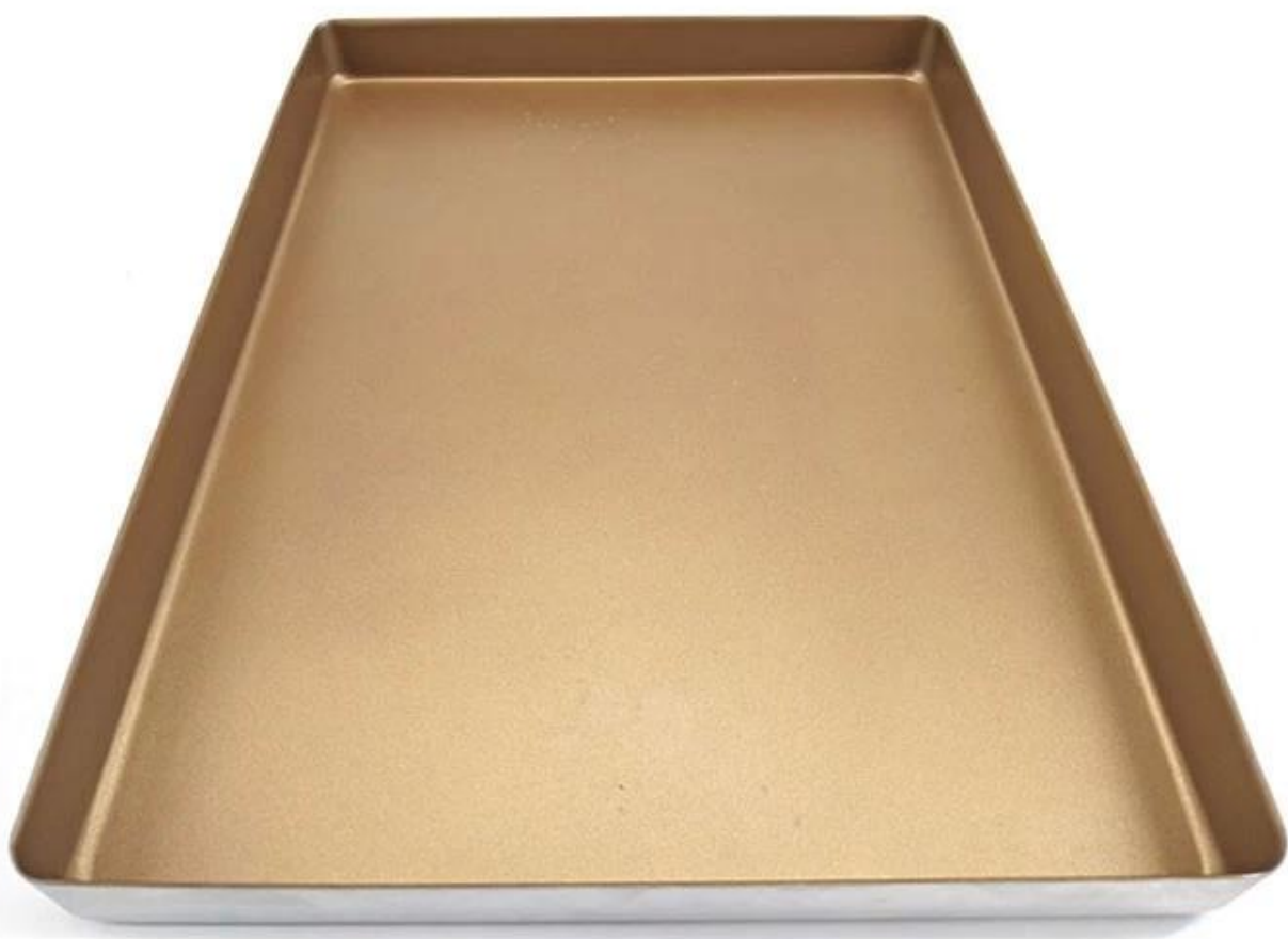
Thick Aluminum Baking Sheet Pan without Rim Straight Edges, Round Corners