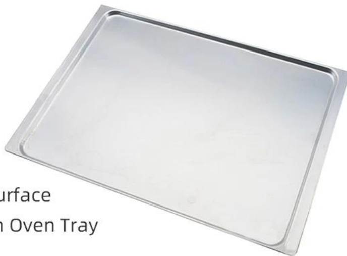
Natural Surface Aluminum Oven Tray