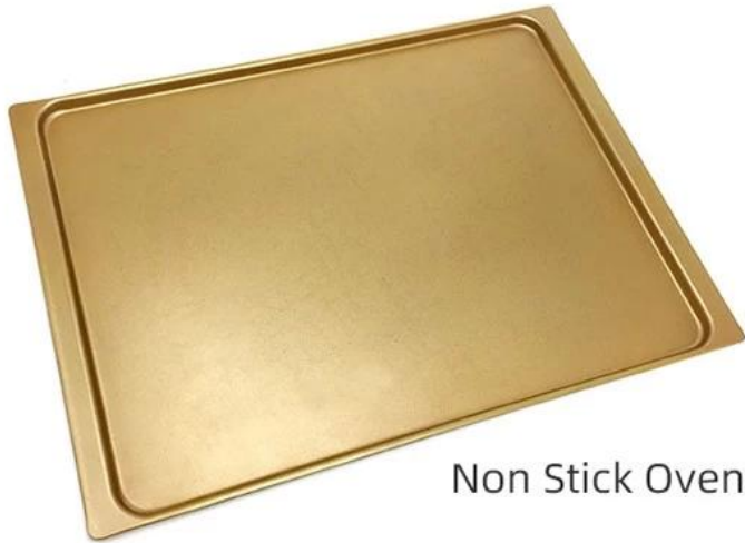
Non Stick Oven Tray