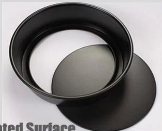
Teflon Coated Surface