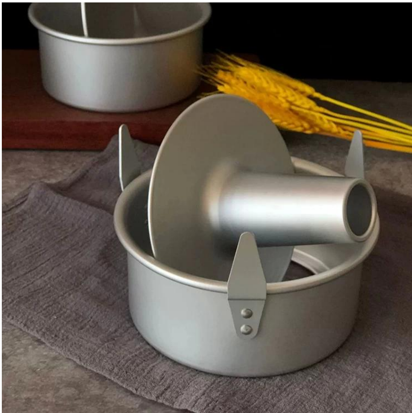
Podobna foremka do ciasta