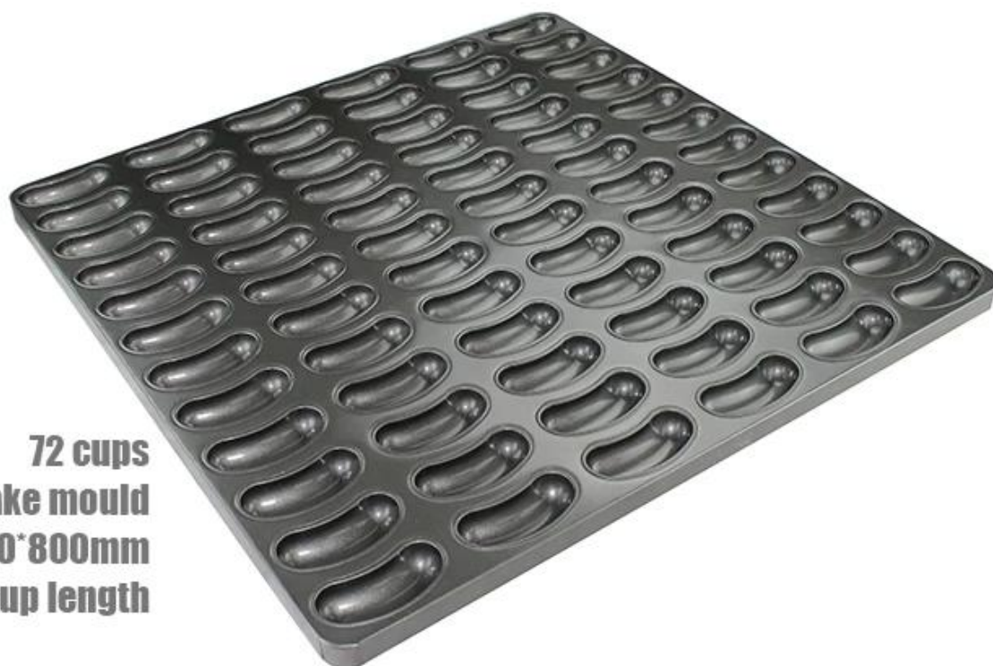
72 cups Banana cake mould 800*800mm 110mm in cup length