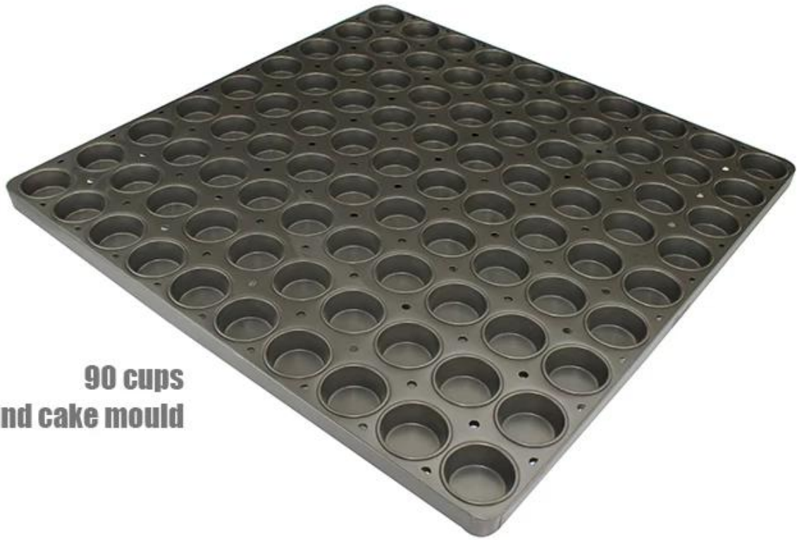
90 cups Round cake mould