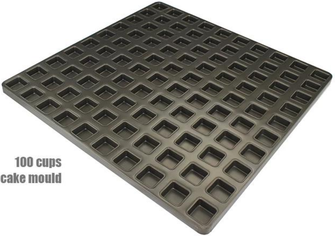
100 cups Square cake mould