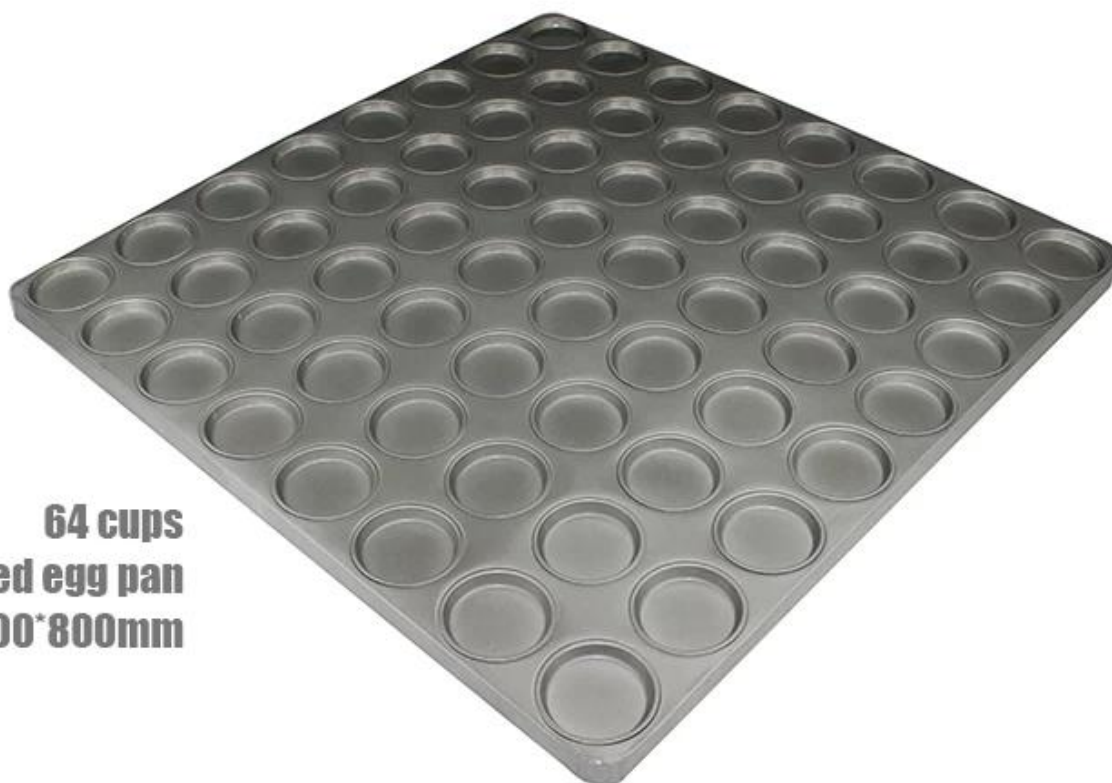
64 cups Fried egg pan 800*800mm

Jeśli szukasz foremki na ciasto w regularnych rozmiarach, możesz potrzebować tej okrągłej 24-kubkowej patelni z ciasta Producent tacek muffinowych w Chinach.