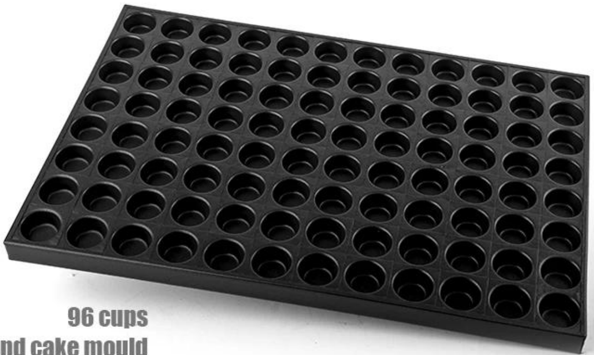
96 cups Round cake mould