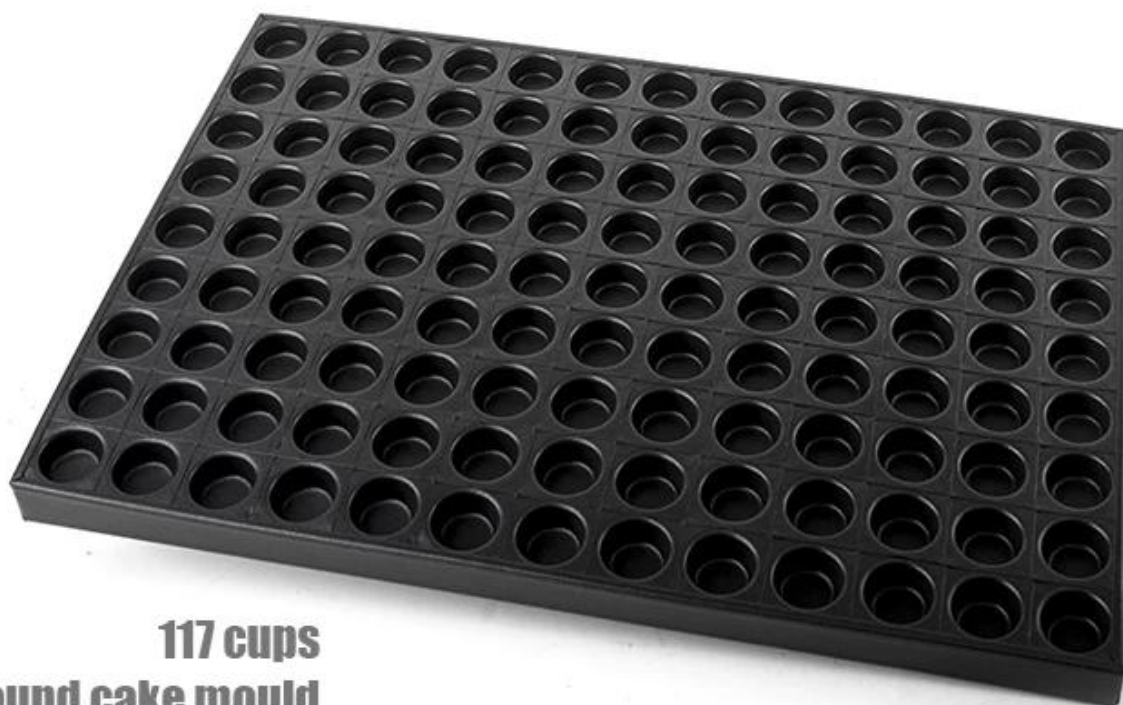
117 cups Round cake mould