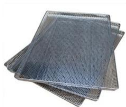
Zdjęcia fabryczne producenta blach do pieczenia Tsingbuy