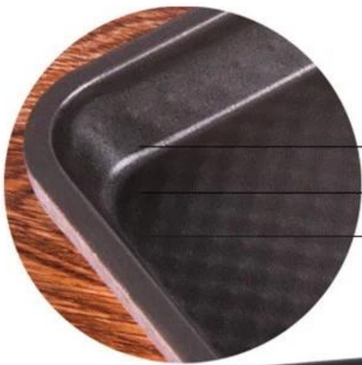
3 layer non stick coating