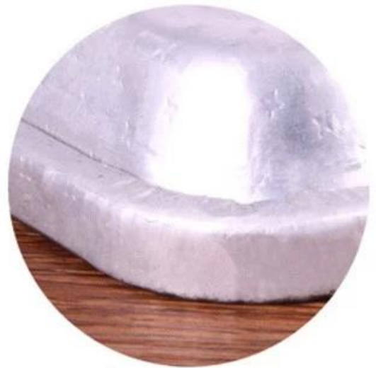
Square metal wire in rim curling edge