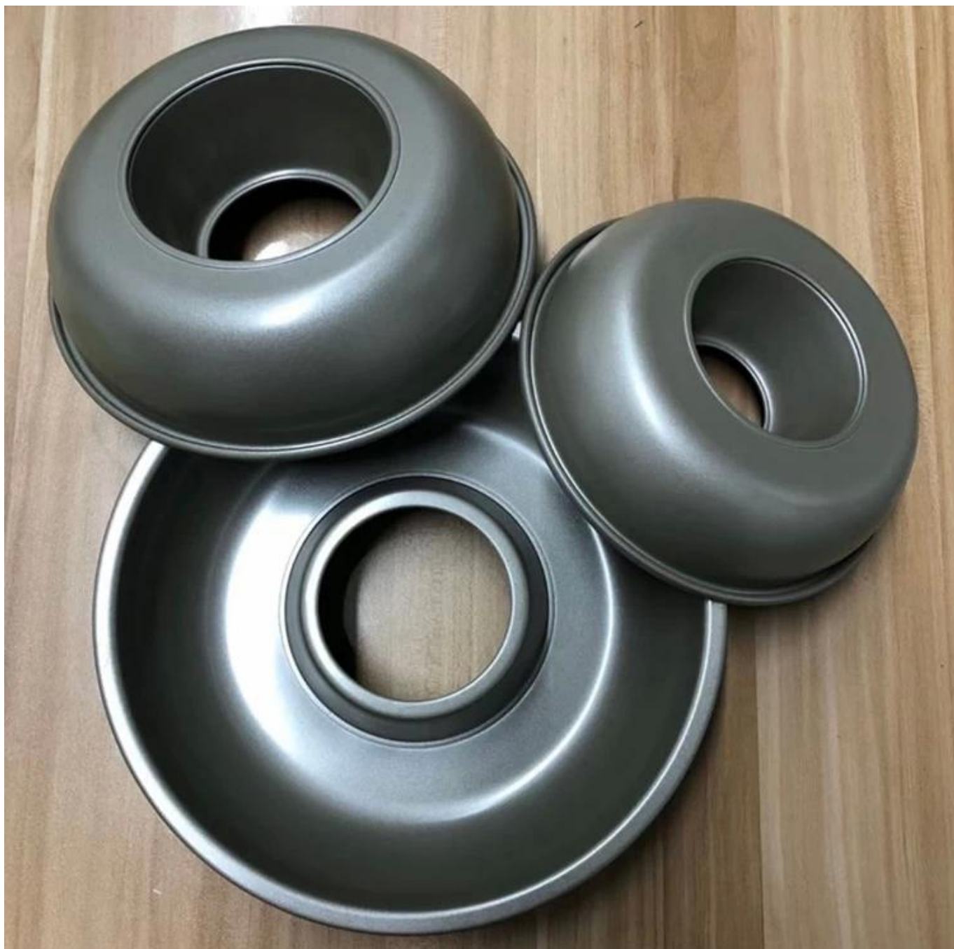
Pokaz fabryki patelni do ciast