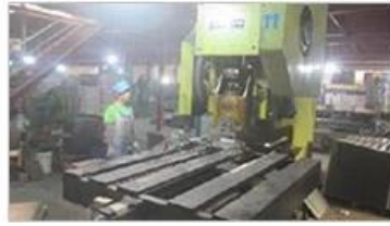
Automatic punching machine