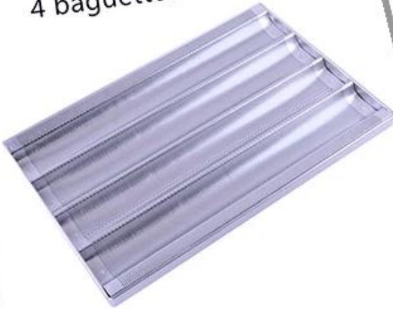
4 baguettes non-stick