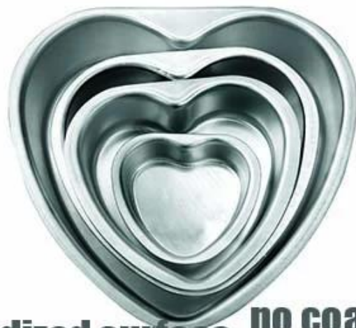
anodized surface no coating