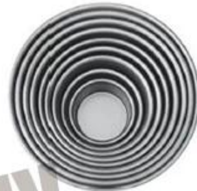
Round Cake Pan ( Anodized )