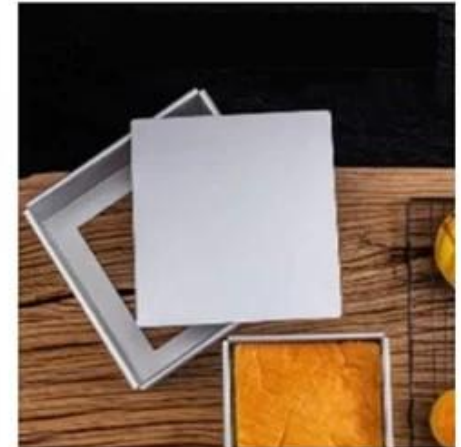
ALUMINUM REMOVABLE BOTTOM SQUARE CAKE PANS