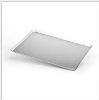
no wire rim